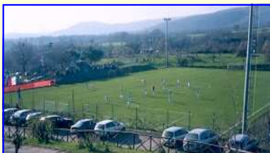
VEDUTA DEL CAMPO SPORTIVO