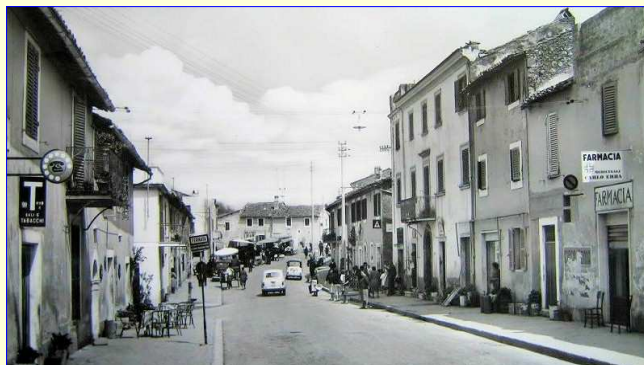
VECCHIA VEDUTA DI CANALE ANNI 50

Il nuovo consiglio della Proloco vuole rendere partecipi tutti i cittadini per tutto ciò che riguarda gli eventi che si svolgono durante l'anno a canale, ed in particolar modo nei mesi estivi; per iniziare voglio spiegare bene quali sono i compiti dell'associazione proloco: innanzi tutto facciamo parte dell'UNPLI (unione nazionale proloco d'Italia), e questo ci garantisce una visibilità al livello sia Regionale che nazionale, (anche quest'anno come per gli anni passati abbiamo aderito al raduno nazionale delle proloco che si tiene a porto San Giorgio). La proloco si occupa della promozione turistica e coordina le contrade e il comitato per le attività svolte